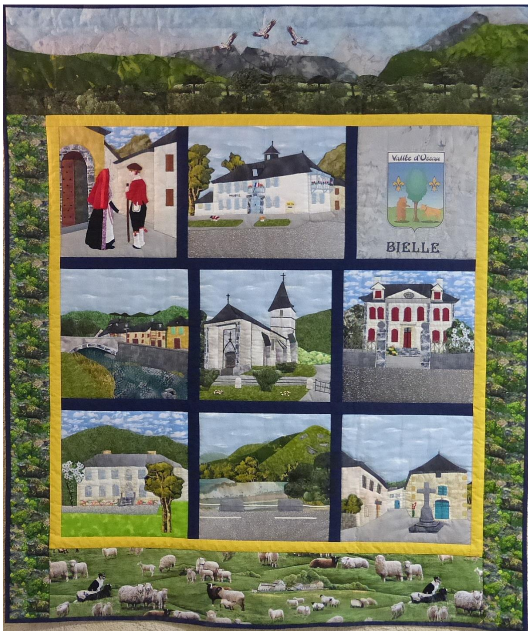
Réalisation du club de patchwork